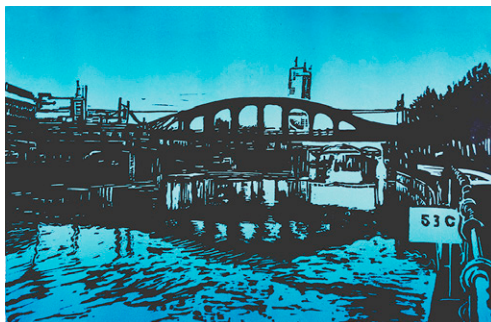
Chaussée de Vilvoorde Lino 30 x 20 cm

Il utilise avec le même plaisir, en fonction du sujet, de l'inspiration et du moment, les différentes techniques : eaux fortes, pointe sèche, linogravure, lithographie.